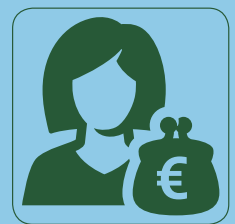
Zelf je zorg organiseren met een pgb